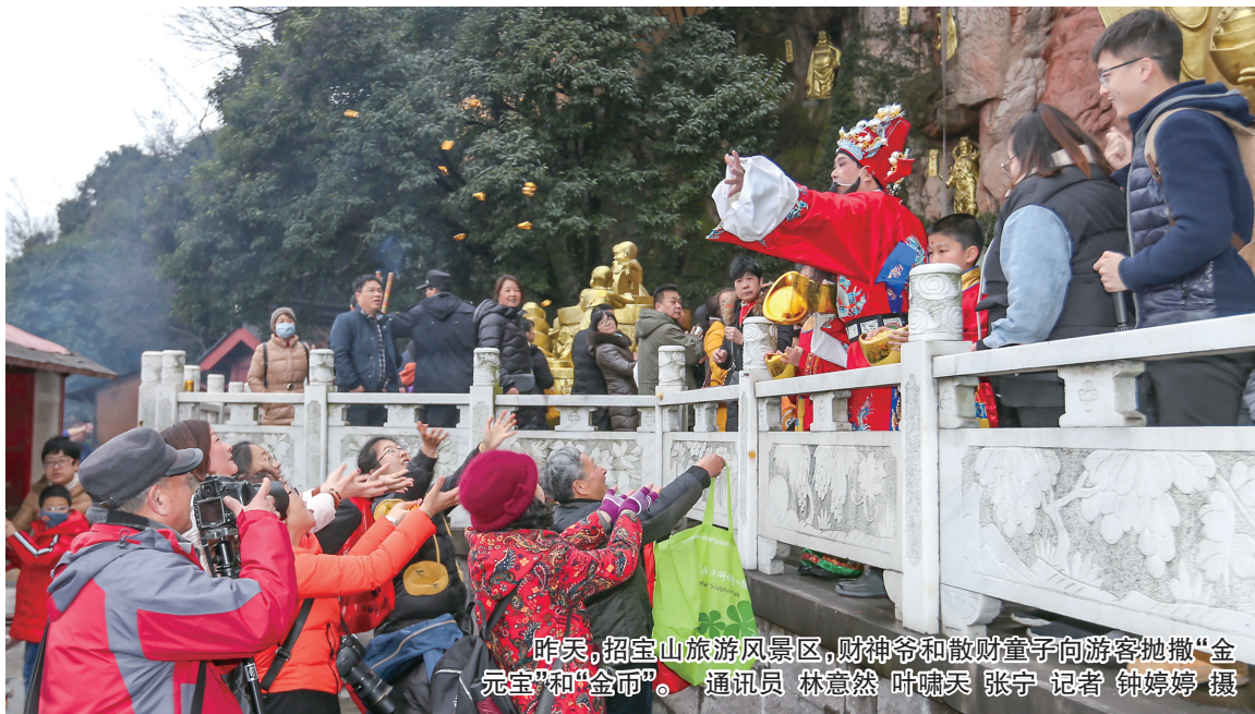
昨天,招宝山旅游风景区,财神爷和散财童子向游客抛撒“金元宝”和“金币”。