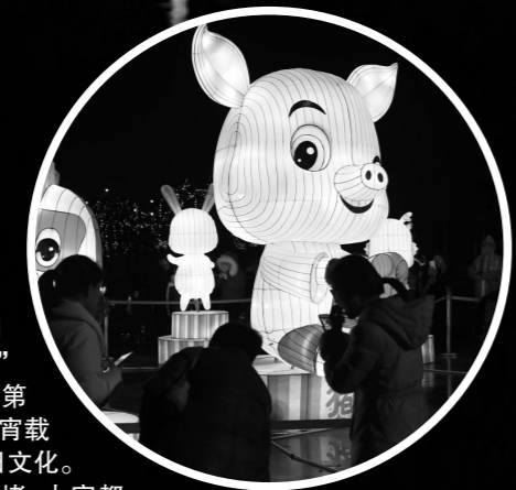
点亮「幸福灯」 「汝湖春晓」里 余姚市泗门镇

笙箫歌舞开美景，花灯龙鼓闹元宵。昨天，“汝湖春晓”余姚市泗门镇第十三届元宵灯会启动仪式举行，灯会将持续三天。同时举行的还有“泗门榜样”颁奖典礼。在这个元宵佳节，泗门镇还有精品小城欢乐游艺网“看看看”走进泗门元宵灯会、“欢乐元宵”余姚市第四届阿拉非遗赶集会、“一人一艺”闹元宵载歌载舞庆佳节等系列活动丰富乡村节日文化。 “前几年天气好的时候，马路都要堵，大家都喜欢看灯会闹元宵！”今年71岁的邵金林老人说。“据《东山志》记载，旧时余姚共十五乡，其中姚北八乡濒临杭州湾，沿海居民久苦海患。泗门当时属东山乡，受害更厉害。元朝至正元年(1314年)春，余姚州判修石堤，即现在的大古塘，修好后百余年来没有发生大的灾害。泗门百姓在大古塘上建龙王庙，每年元宵造龙灯在大古塘上盘旋，以祈求神灵保佑一方平安。”余姚市社科联谢建龙说，元宵灯会已有700年历史了，非常有名。 第十三届元宵灯会以“逐梦新时代，点亮幸福灯”为主题，突出“灯会，点亮更美好的生活”这一宗旨，通过六大系列活动，既圆满呈现阅老故里深厚的文化底蕴和人文气息，又充分展现泗门人民日益丰富的文化生活和精神追求，力求营造欢乐、祥和的节日氛围。