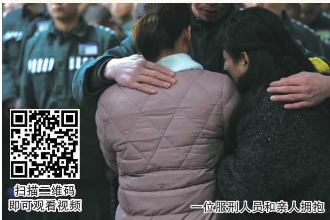
一位服刑人员和亲人拥抱