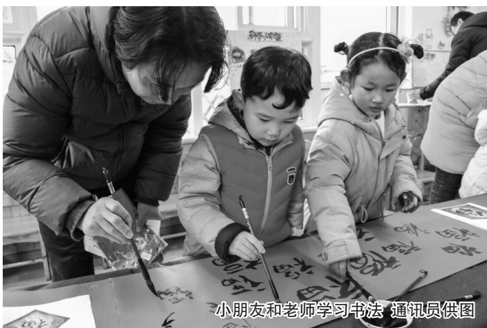
小朋友和老师学习书法

本报讯(通讯员 练丹妮 记者 叶佳)剪纸、扎灯笼、做糖葫芦……昨天下午,鄞州区首南街道文华社区和学府实验幼儿园共同为小朋友精心策划了一场趣味盎然“新春余韵”民俗游园活动,将优秀的民俗文化资源带到社区幼儿身边。