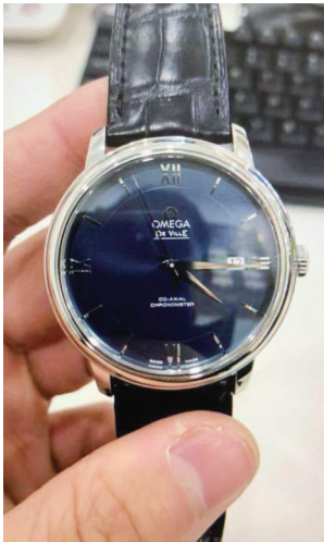
男子卖掉的金器和手表