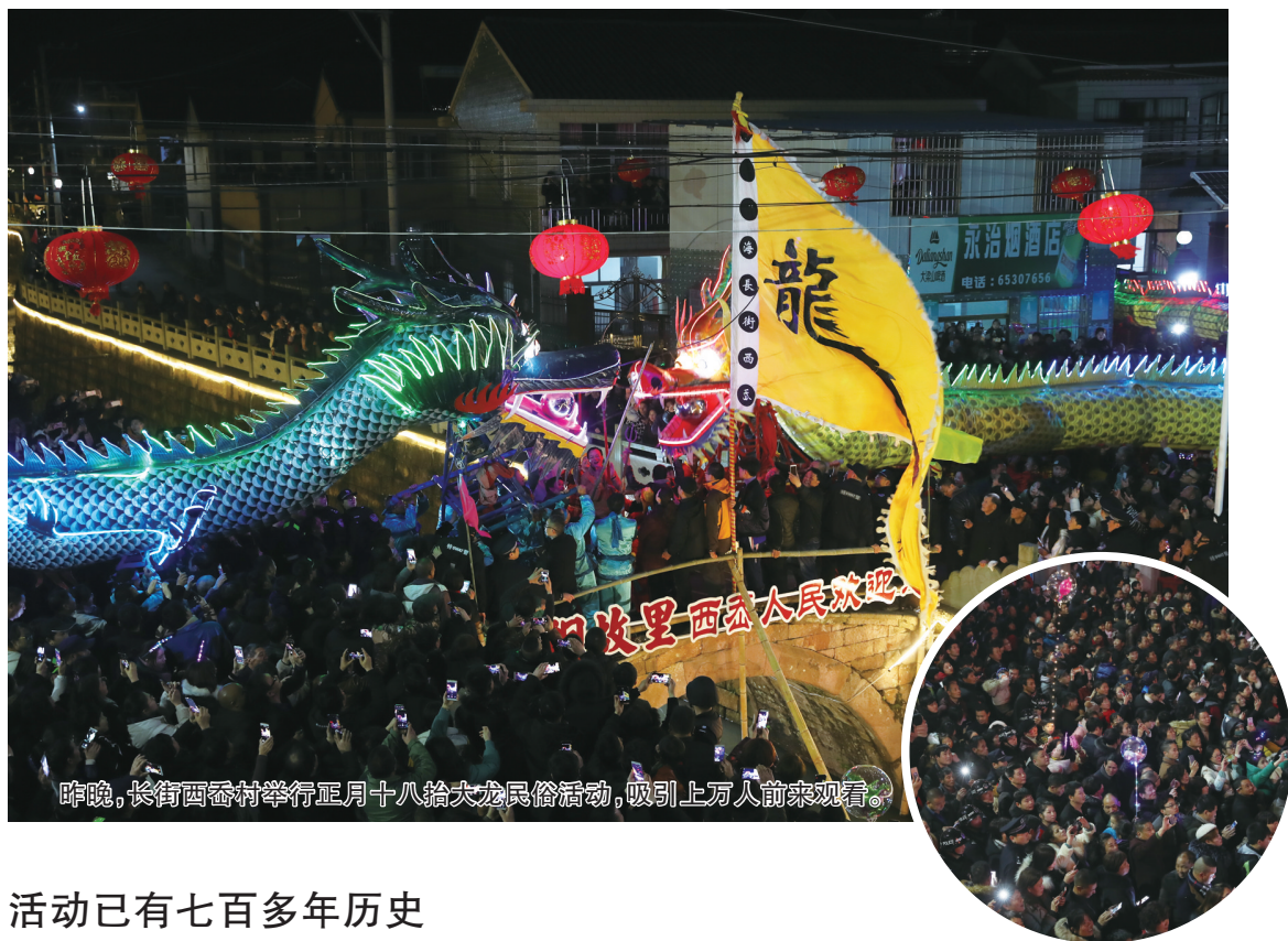
昨晚,长街西岙村举行正月十八抬大龙民俗活动,吸引上万人前来观看。