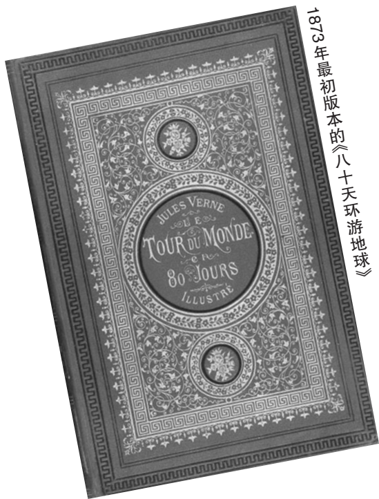
1873年最初版本的《八十天环游地球》

随着电影《流浪地球》的热映,科幻著作《三体》的走热,中国科幻已成为时下最热门话题。近期,宁波市图书馆微信号分享的一则文章引发众多关注。百年前,当开眼看世界的中国人拿着一本在宁波所翻译的科幻著作,究竟是怎么一段故事。