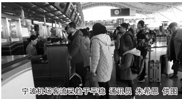
宁波机场客流已趋于平稳