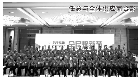
任总与全体供应商合影

宁波苏宁在3月15日至3月17日推出“全民焕新节”,新品上新、以旧换新、服务用心,用优惠的价格和优质的服务给广大消费者带来初春家电购物节。以旧换新方面,通过苏宁易购、品牌商、金融服务产品等发放三大补贴,联合百大品牌,千款产品,打造“全民焕新节”,继续稳国家电渠道领先的市