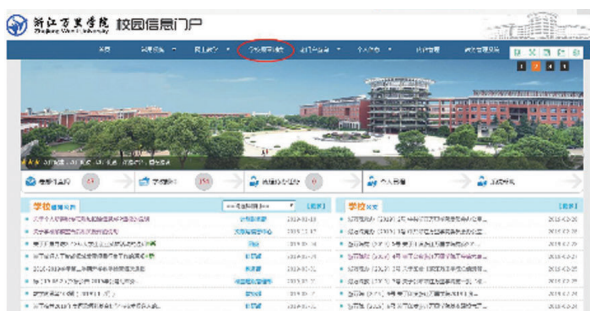
浙江万里学院:助推学校“最多跑一次改革”