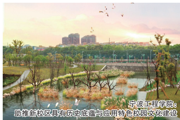
宁波工程学院: 助推新校区具有历史底蕴与应用特色校园文化建设