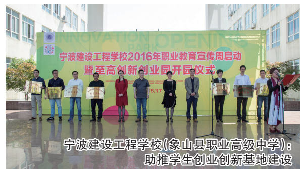
宁波建设工程学校(象山县职业高级中学): 助推学生创新创业基地建设