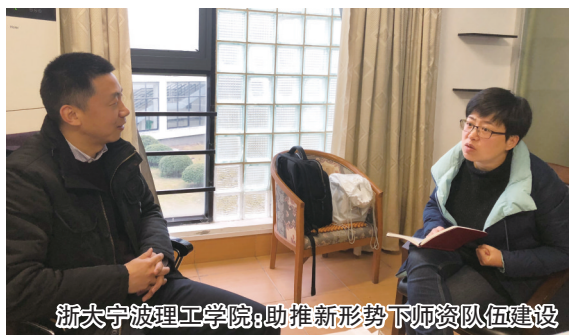
浙大宁波理工学院:助推新形势下师资队伍队伍建设