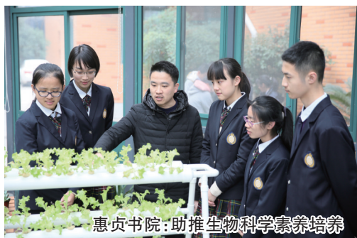
惠贞书院:助推生物科学素养培养