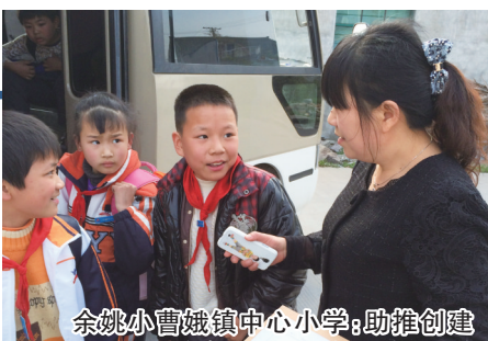
余姚小曹娥镇中心小学:助推创建 “乘学生乘过的车,走学生走过的路”学 生家庭走访制度