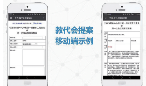
教代会提案 移动端示例