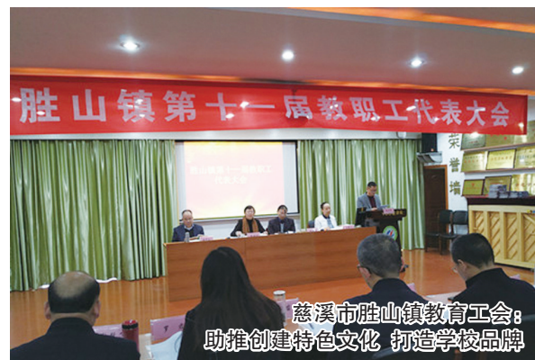
慈溪市胜山镇教育工会: 助推创建特色文化 打造学校品牌