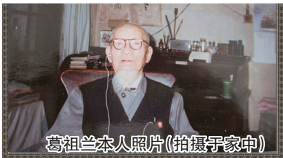
葛祖兰本人照片(拍摄于家中)

葛祖兰,宁波籍翻译家、作家。其创作俳句闻名中日学界,有《日本俳谐史》、《俳句困学记》、《祖兰俳存》与《祖兰俳存补遗》等。曾获日本《杜鹃》诗刊“杜鹃诗人”和最高荣誉“同人”称号及《九年田》诗刊的“九年田推荐作家”的荣誉称号。