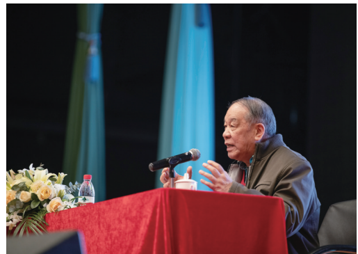
刘心武开讲《红楼梦》

前晚刘心武的讲座在“朋友圈”里更是火热异常。宁波师生纷纷转播了刘老师的金句——“如果有人读红楼梦有用吗?你会怎么回答?”“这是一个民族的文化底蕴,是宝藏,是家底。”