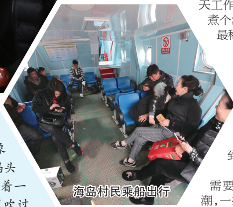
海岛村民乘船出行

乍暖还寒的日子,象山石浦延昌码头有些冷清。随着一阵咸腥的海风吹过,水面荡起涟漪,等候在码头的人开始朝海岸走去,“象农渡98”号渡船靠岸了。