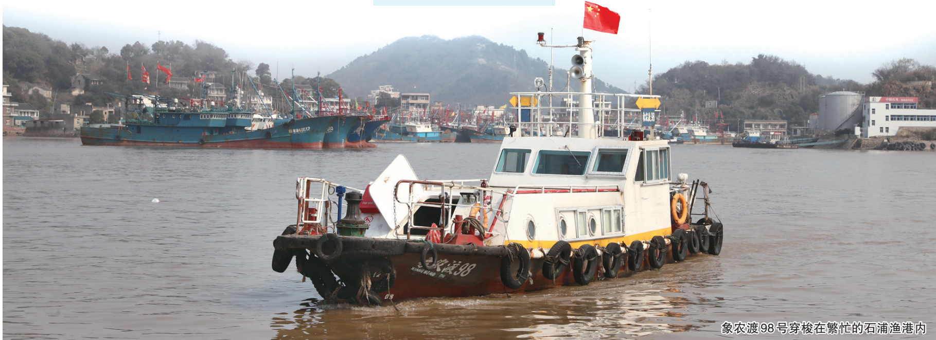
象农渡98号穿梭在繁忙的石浦渔港内

她说,女儿在温州上大学,明年就大四了。“女儿大学毕业,我也快退休了。我想好好去看看这个世界,把以前耽误的日子补回来。”