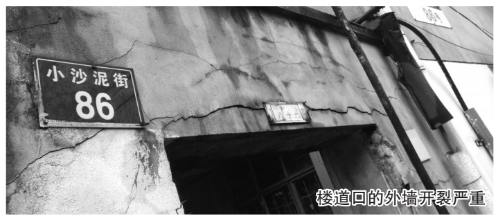
楼道回的外墙开裂严重