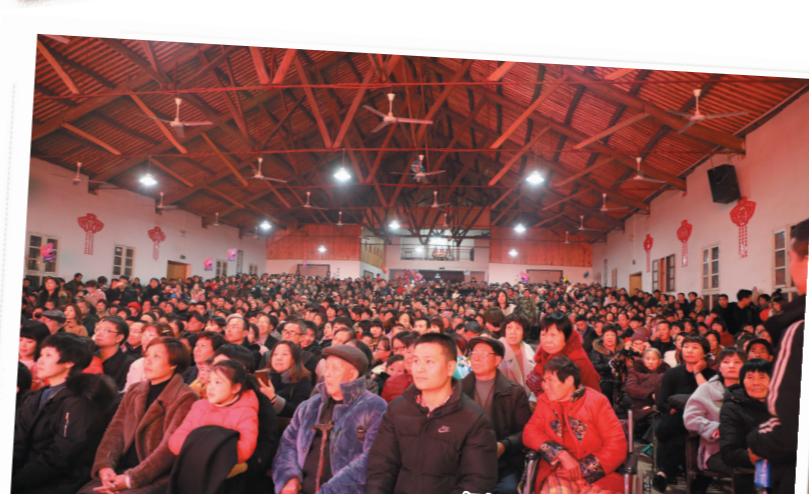
每场村晚都能吸引不少的村民