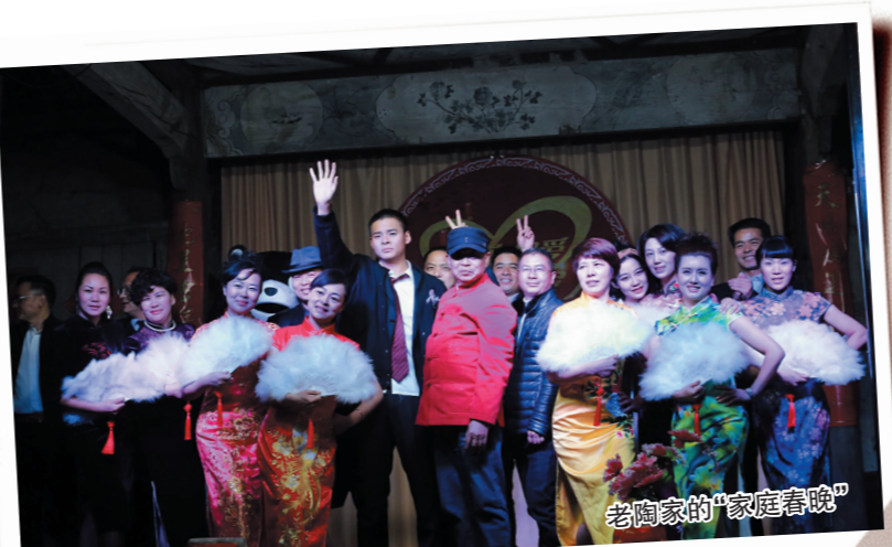
老陶家的“家庭春晚”