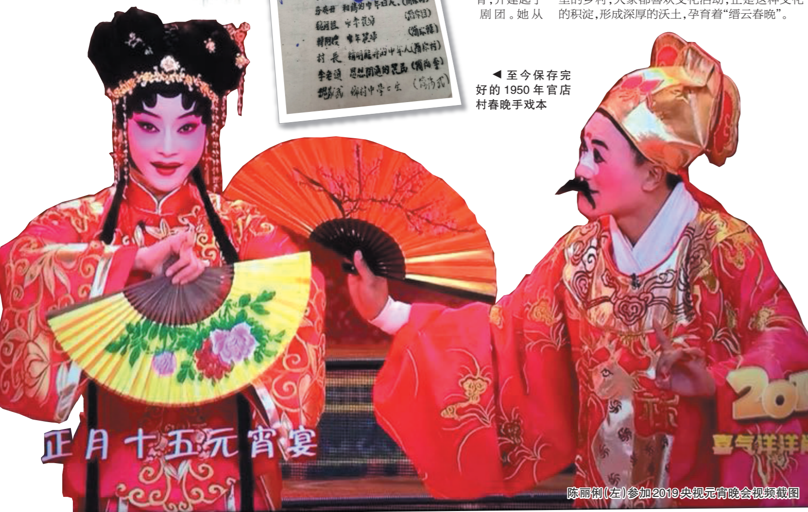
陈丽俐(左)参加2019央视元宵晚会视频截图