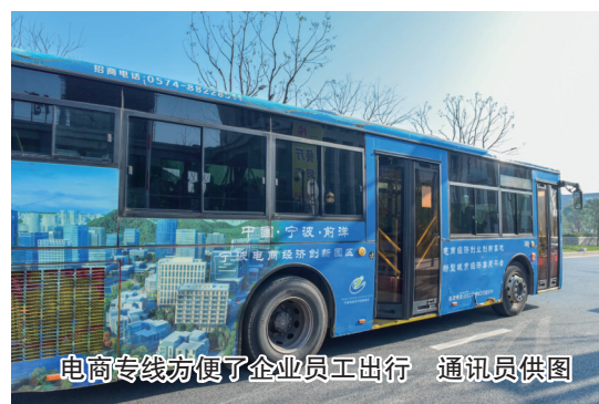
电商专线方便了企业员工出行