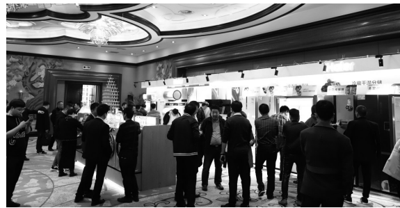
订货会现场火爆,订购记录屡创新高

接入零售云,省心做老板,这不只是一句口号,更经过市场验证的、实实在在让老板轻松赚钱的靠谱解决方案。站在消费升级的风口,面对零售行业的巨大变革,苏宁将与合作伙伴一同努力,通过全场景、全价值