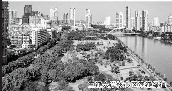
三江六岸核心区滨江绿道

而全市性的“未来社区”规划,目前市自然资源和规划部门正在进行导则的制定工作。如果市民对这块内容感兴趣,可以将自己的意见和建议告诉现场工作人员。