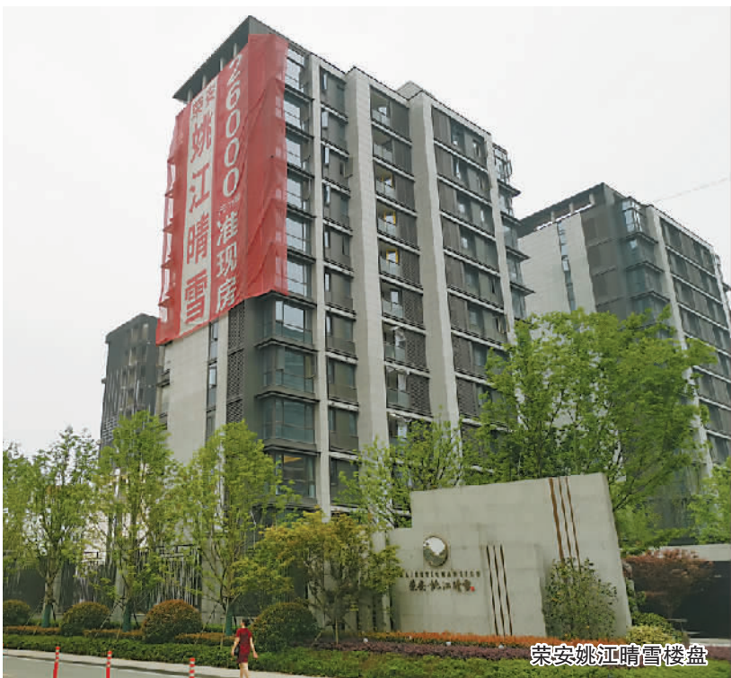
荣安姚江晴雪楼盘