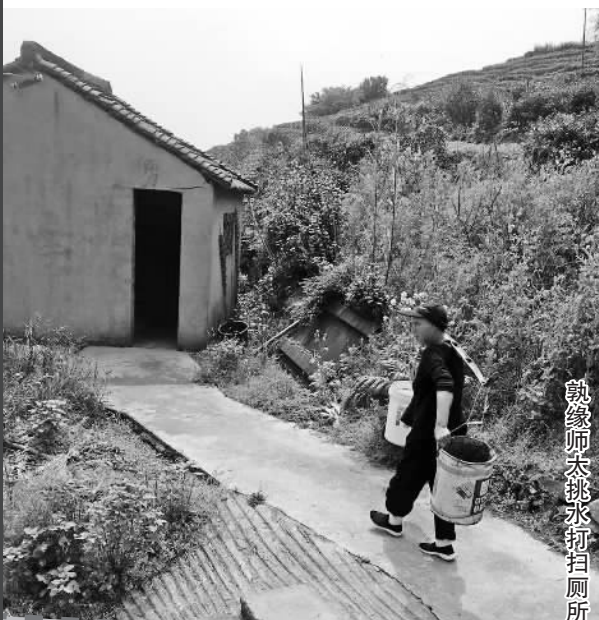
孰缘师太挑水打扫厕所

记者还了解到,早在两三年前,洪塘街道曾拨付1500元/月的清扫费,委托寺院雇工清扫山上厕所,但之后取消了这项费用。