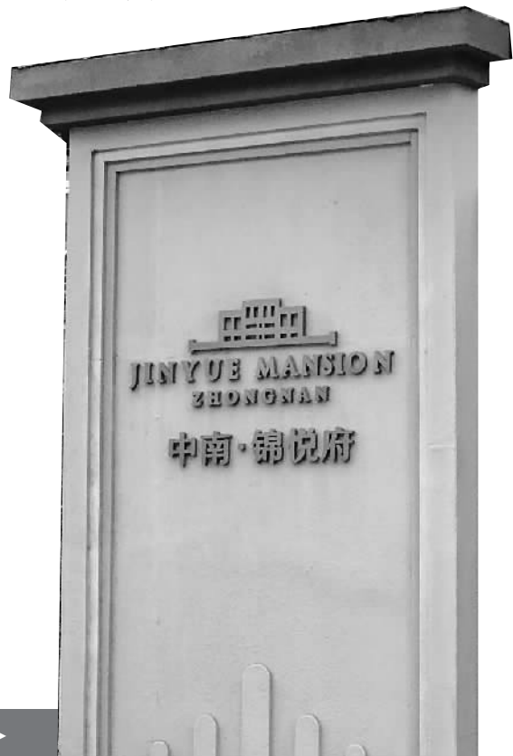
中南锦悦府售楼处▶

无法补齐首付款的购房者该怎么办？他们付过的认购款能否拿回来？本报记者将继续关注。