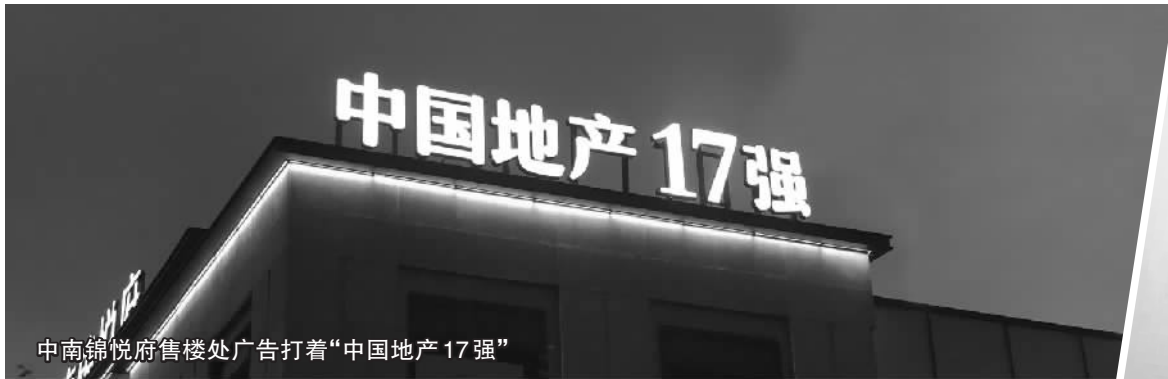
中南锦悦府售楼处广告打着“中国地产17强”