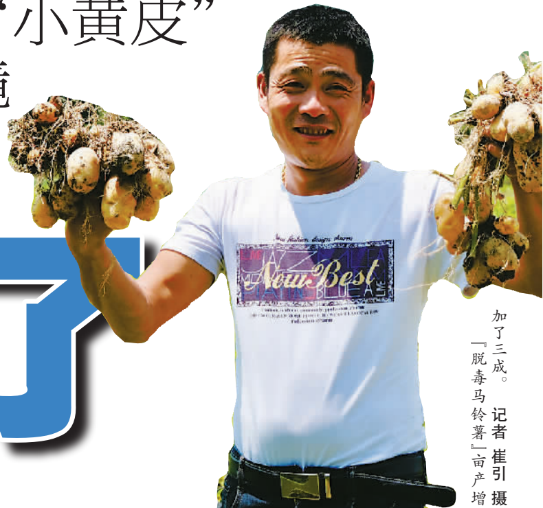
加了三成。「脱毒马铃薯」亩产增