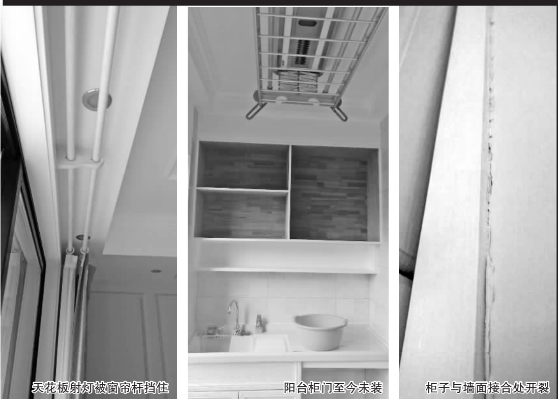
天花板射灯被窗帘杆挡住