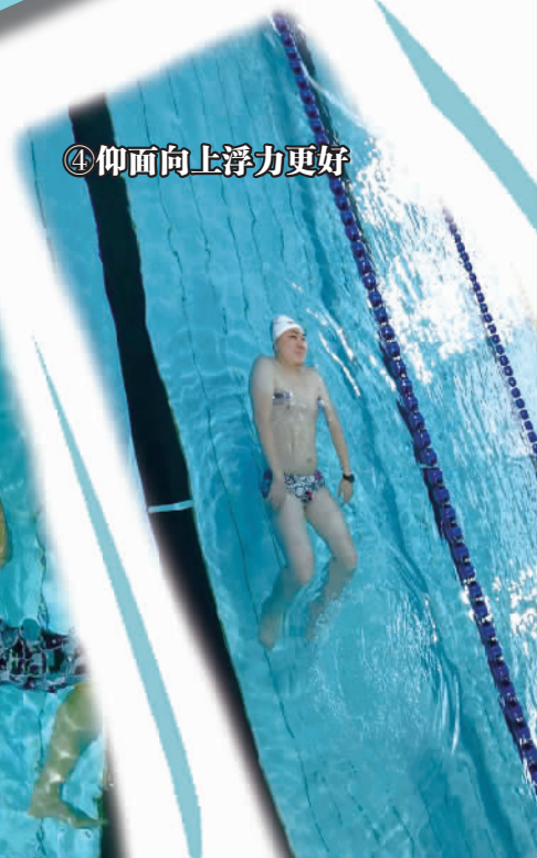
④仰面向上浮力更好