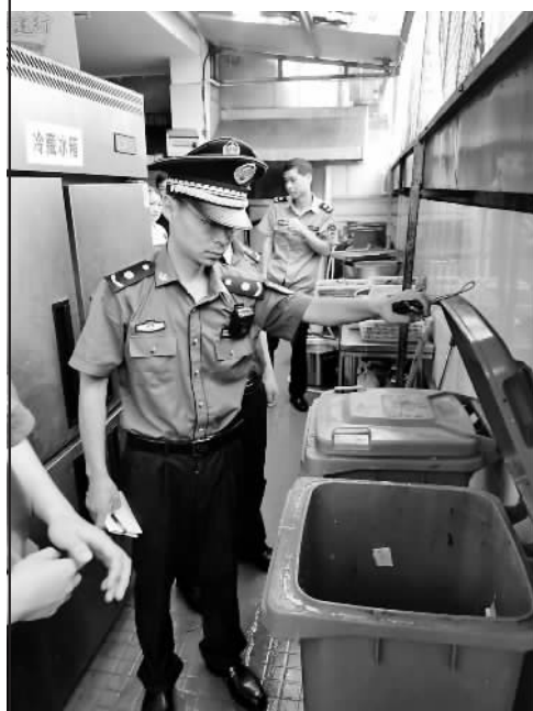
执法队员在现场检查。

针对机关单位垃圾分类不到位问题,海曙区机关事务局、海曙区垃圾分类办等部门均表示将引以为戒、举一反三,表示将进一步加强宣传教育,提高机关干部对垃圾分类的思想认识,各党总支、党支部要经常开展垃圾分类的宣传、指导和培训,将各项主题教育实践活动与垃圾分类结合,让广大党员干部认识到垃圾分类的紧迫性和重要性,增强他们的责任感和使命感。同时,注重督促机关干部将垃圾分类理念落实到行动中去,对机关办公区域、单位食堂分类投放情况进行常态化检查,就存在的问题及时督促整改。对分类意识薄弱、分类不好的单位,要约谈单位一把手;情节严重的,依据新出台的垃圾分类条例进行处罚,并通过媒体予以曝光。