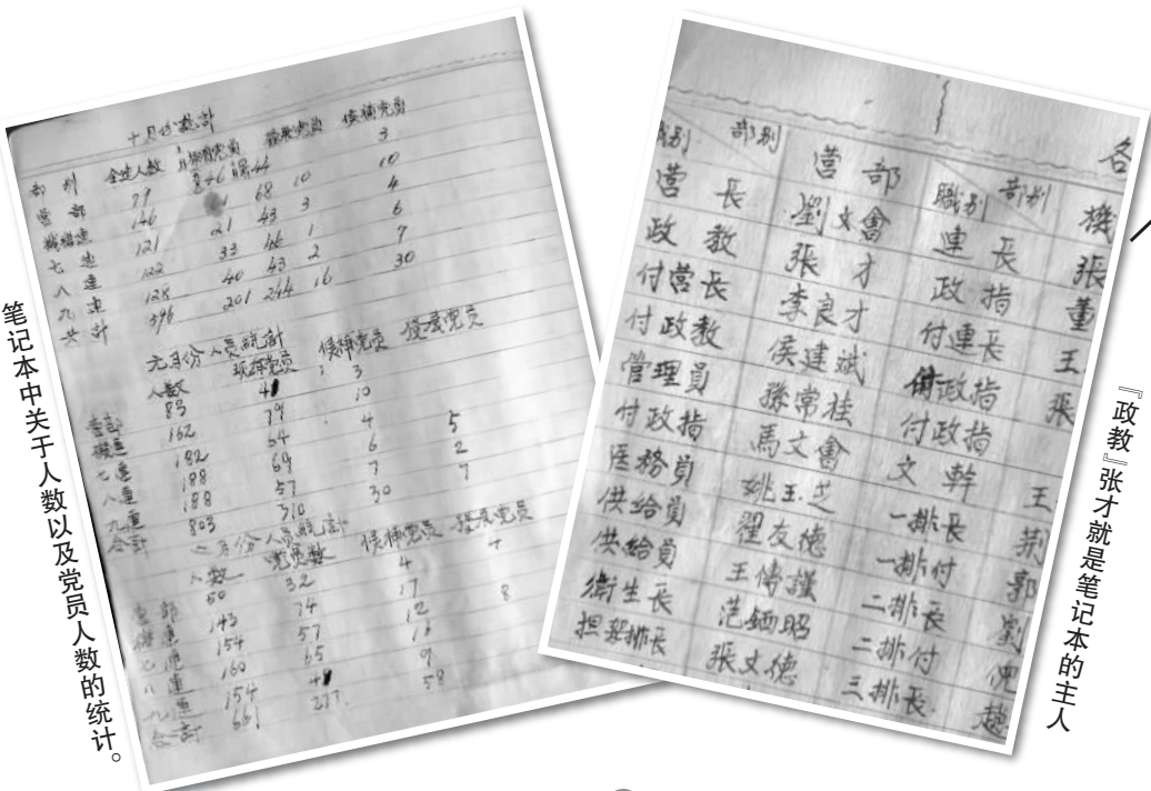
笔记本中关于人数以及党员人数的统计。