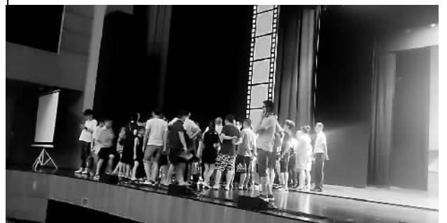
市民与剧院工作人员商量退款等事宜。

本报讯(记者 薛智谊 文/摄)昨晚是百老汇英文原版音乐剧《绿野仙踪》在宁波大剧院演出的第一天,观众们乘兴而来扫兴而归,一直等到晚上8点多钟,演出迟迟不开始,剧场工作人员出来说“演员不演了”,大家只得悻悻而归,退票等事宜有待解决。