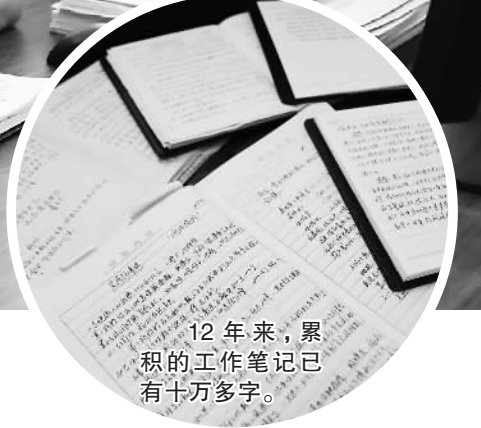
12年来,累积的工作笔记已有十万多字。