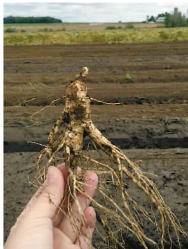
威斯康辛州肥沃土地种植出来的西洋参,品质独特。