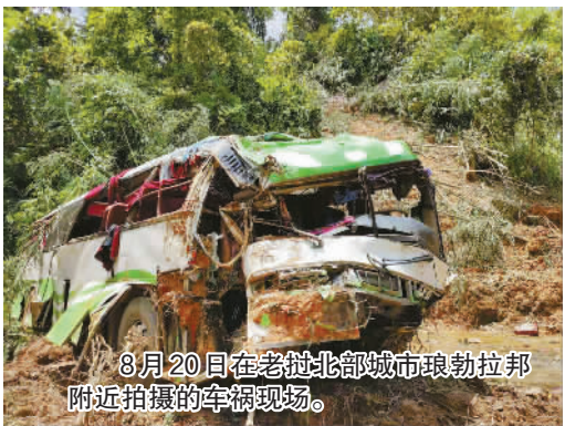
8月20日在老挝北部城市琅勃拉邦附近拍摄的车祸现场。

外交部发言人耿爽20日在例行记者会上确认，一辆载有中国游客的旅游大巴19日在老挝发生严重交通事故，截至北京时间20日13时，车上44名中国公民中，13人不幸遇难，31人受伤。