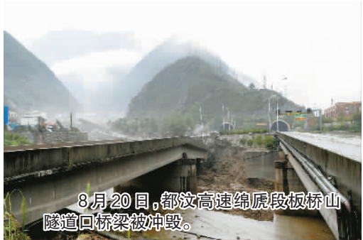
8月20日，都汶高速绵虎段板桥山隧道口桥梁被冲毁。

受强降雨影响，四川省阿坝州汶川县多处发生泥石流，其中三江镇、水磨镇、银杏乡等地灾情较重，境内电力、通信暂时中断，目前汶川县至成都、理县方向道路均已中断。1名消防员在救援中牺牲。