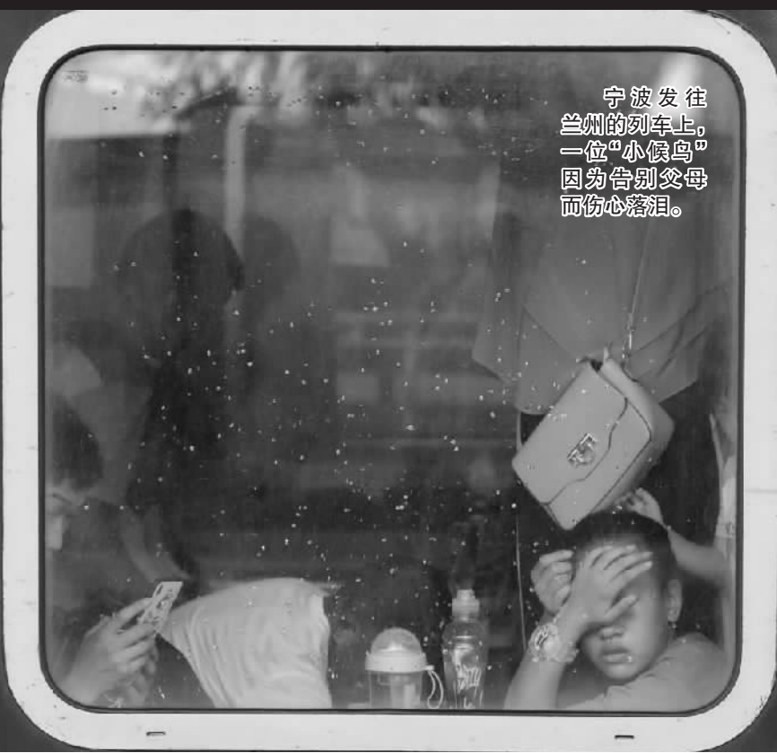
宁波发往兰州的列车上，一位“小候鸟”因为告别父母而伤心落泪。

“肯定有点不舍啊！跟爸爸妈妈一起，他们能带我去好多地方玩，比老家好。”记者采访了5名“小候鸟”，对于爸爸妈妈，他们想通过我们传达他们的“悄悄话”。