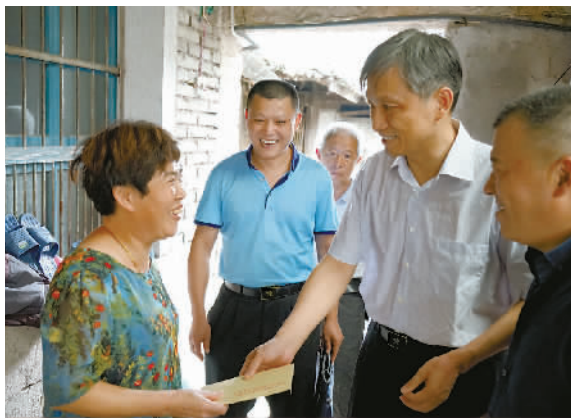
宁波海关为贫困家庭提供帮扶。