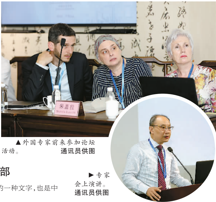
▲外国专家前来参加论坛活动。