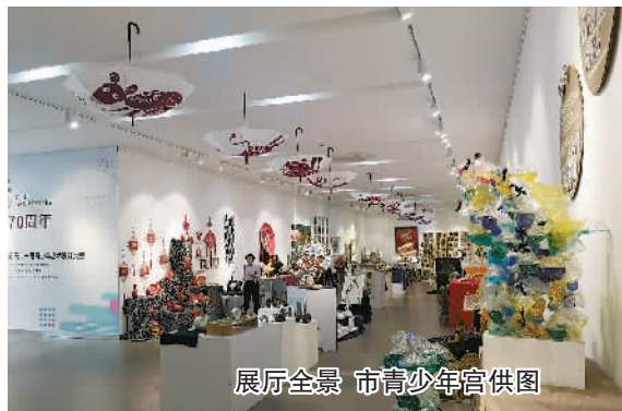
展厅全景

本报讯(记者 朱琳 通讯员 费跃飞 王月芳)昨天上午,海曙区药行街上的117艺术中心内人头攒动,他们大多是来自全市各中小学、幼儿园的学生和家长,这里正在举行宁波市少儿书画创意大赛和宁波市第十一届青少年艺术设计大赛作品展,一幅幅栩栩如生的书画,一件件颇有创意的作品,将青少年的创作灵感表现得淋漓尽致。本次作品展由共青团宁波市委、宁波市教育局等主办,宁波市青少年宫承办,从9月22日起,在117艺术中心展出,将持续到9月26日,其间市民朋友们可以前往,一饱眼福。