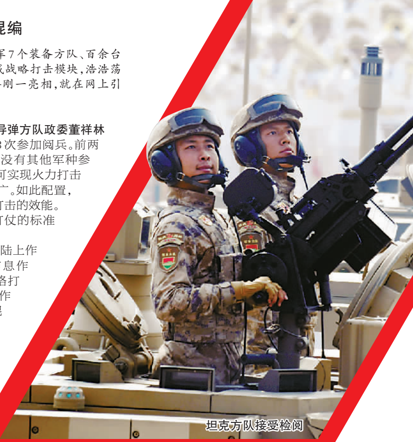
坦克方队接受检阅