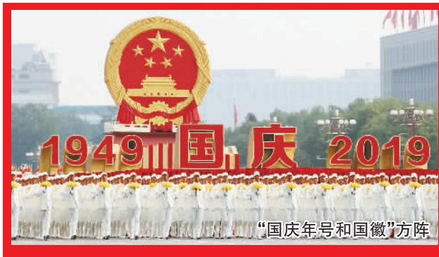
“国庆年号和国徽”方阵