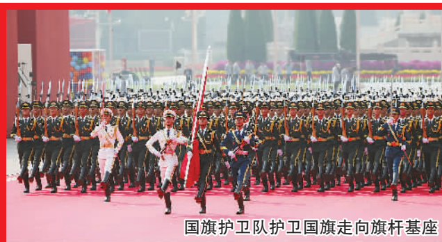
国旗护卫队护卫国旗走向旗杆基座

10月1日,庆祝新中国成立70周年阅兵盛典在北京举行。十里长街,铁流滚滚,浩荡而来;秋日长空,战机翱翔,傲视苍穹……宏伟的天安门见证着盛大阅兵的一个个精彩瞬间。