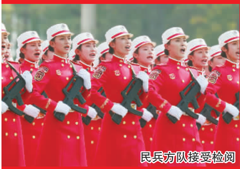
民兵方队接受检阅