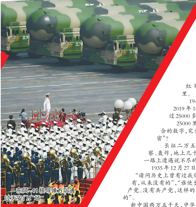
东风-41核导弹方队通过天安门广场