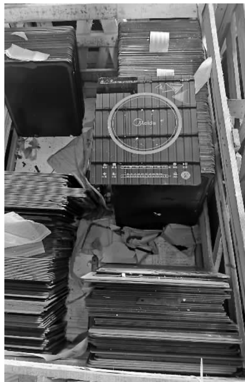
警方查获的假冒电磁炉面板。

警方提醒:现如今,电磁炉已经占据了家用电火锅的大半地盘,而假冒伪劣的电磁炉面板除了外观容易破损、塑料味重等问题以外,还很有可能发生电磁炉爆炸等危险事故。消费者购买家用电器一定要去正规商场、商家的官方店铺购买,并且所购买的商品一定要具备发票、三包凭证、保修卡和说明书,否则很难维护自己的合法权益。对于明显低于市场价格的,要提高警惕,切勿贪小便宜而吃了大亏,若发现假冒伪劣线索,可及时向警方提供。