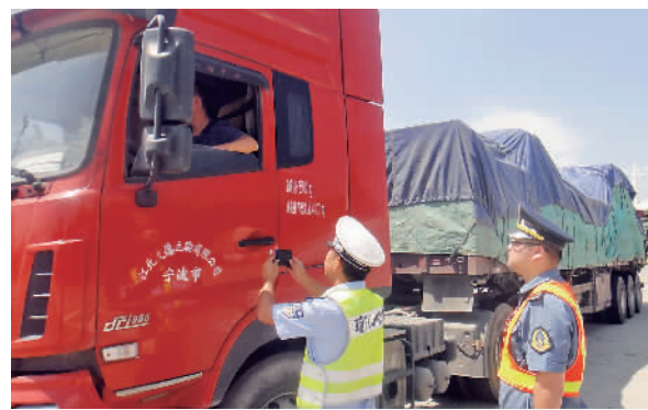
执法人员在检查中。

据了解,宁波境内高速公路共计567公里,目前55个需要安装入口称重设备的高速公路收费站已全部完成称台的安装,即将进入设备联调阶段。根据计划,宁波将于2019年底实现全部高速公路入口称重设备的全覆盖,届时违法超限超载货车将不能上高速。下一步,普通公路的超限超载信息将同时接入省治超平台,从严打击超限超载。在2020年底前,宁波市高速公路货车车辆平均违法超限超载率将控制在0.5%以内。