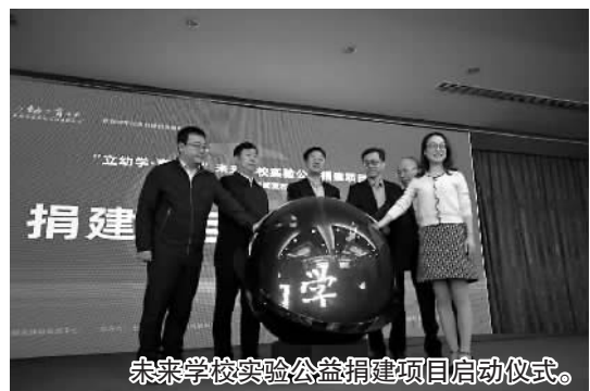
未来学校实验公益捐建项目启动仪式。