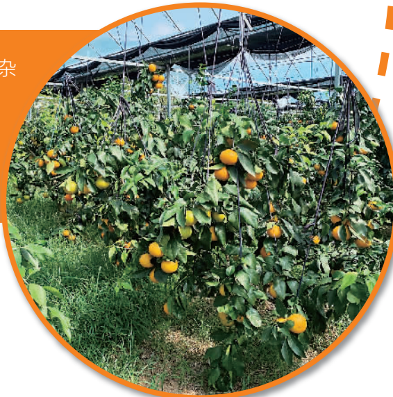
等待采摘的象山“红美人”

此外,因为今年产量增加,品质好坏可能出现分层,所以象山红美人的价格区间可能会比较大。“我们一般将6两以上单果称为大果,4两以上的称为中果,4两以下是小果。今年品质好的大果价格和往年相比,整箱价格会便宜二三十元,折算下来每斤在三十元左右,品质一般的可能一斤十几元就能买到了。”郑恩火说。