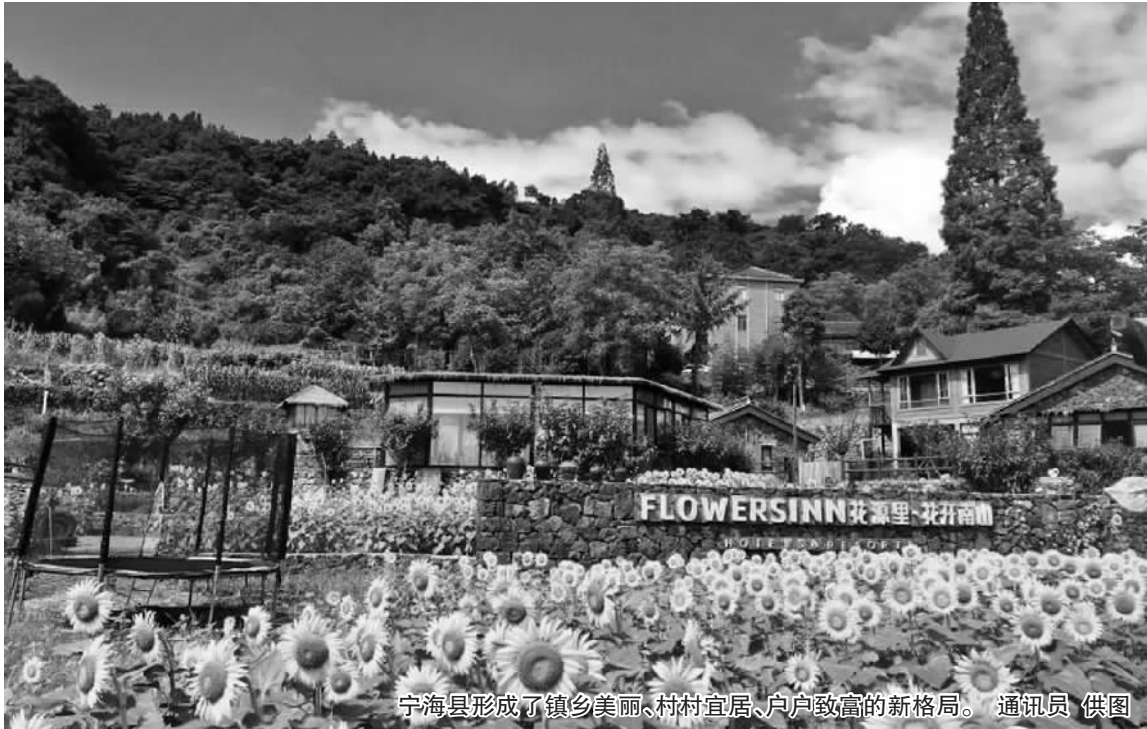
宁海县形成了镇乡美丽、村村宜居、户户致富的新格局。

本报讯(记者 王冬晓 通讯员 蒋攀 徐铭峰 徐丽)11月16日,在湖北十堰市举行的中国生态文明论坛年会上,生态环境部命名表彰了第三批23个“绿水青山就是金山银山”实践创新基地,宁海县榜上有名,这也是宁波市首个“绿水青山就是金山银山”实践创新基地。