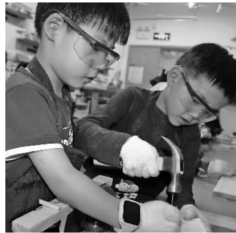
探讨会上课中互动

而宁波市鄞州区探索出的“城乡融合共生、干群对话式共商、主体多元式共治、权力清单式共管、事务契约式共建、成果普惠式共享”的基层全域治理之路,大力推进了城乡接合部的治理。整治后的接合部兼具城乡优势,环境大为改观,成了居民的乐园。教育、环境、医疗、交通多种资源共享,增加了城市的吸引力,也体现了“人民城市为人民”的宗旨。