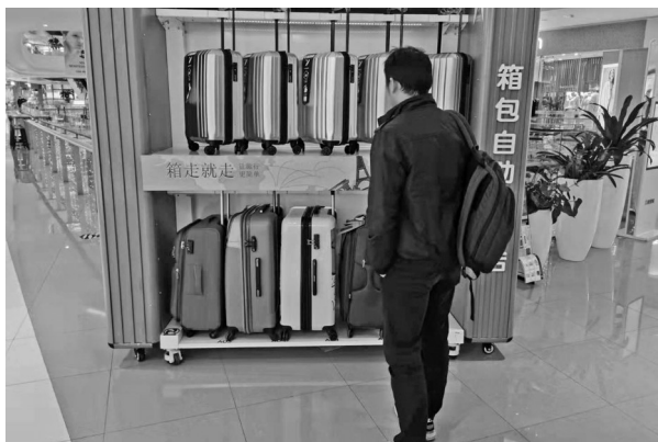
一名消费者在箱包自助销售机前浏览商品。

本报讯(记者 毛雷君 文/摄)目前，东部银泰城的自助箱包售卖机，吸引了不少人的目光。