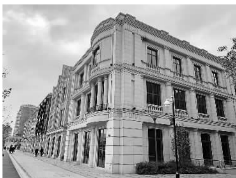
老外滩国际时尚街的实景图

根据“一年出形象、两年见成效、三年成规模”的战略部署,宁波文创港将于今年底具备城市展示功能;2020年底基本完成文创科创的产业培育;2021年底未来社区将初具规模。