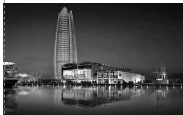
爱珂演艺广场将突出海丝特色(效果图)

除了爱珂演艺广场外,甬江两岸附近已建成的有宁波书城、和丰创意广场、老外滩和美术馆,汇集了城市美术馆、历史街区、商业综合体、演艺中心等多种业态。预计随着明年各新生业态的集中亮相,甬江两岸将变成一条更高格调、充满时代气质的城市文化长廊,市民将乐享更丰富的“亲水生活”。