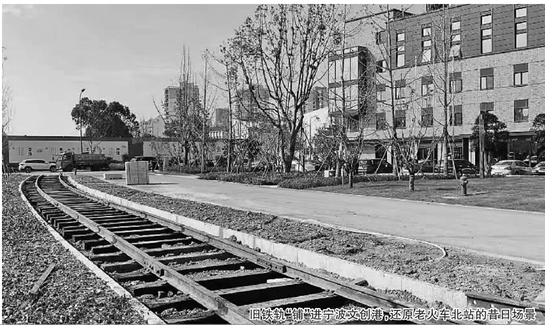
旧铁轨“铺”进宁波文创港,还原老火车站的昔日场景

三江汇流,奔涌入海,甬江两岸曾是宁波近现代工业的集聚区,有鲜明的海洋文化特色。临近跨年,甬江两岸的一批重大项目将进入试运行阶段或逐步撩开面纱,其中包括宁波文创港项目和老外滩国际时尚街项目,宁波渔轮厂也将于明年“变脸”为宁波文化演艺时尚地标。曾经沧桑的甬江两岸正在发生一场美丽的“蝶变”。 □记者 周晖 文/摄