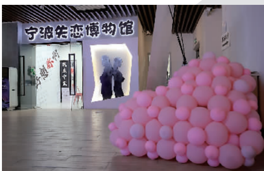
位于开明街上的宁波首家失恋博物馆,昨天傍晚时分门可罗雀。