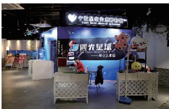
昨晚,东门口银泰百货内的宁波星空失恋博物馆,店员等待顾客上门。