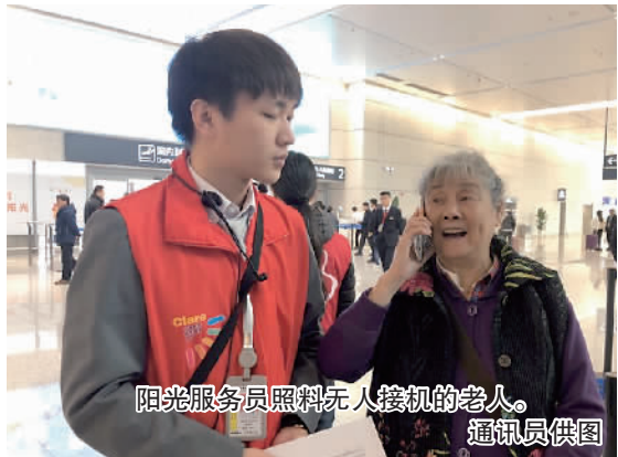
阳光服务员照料无人接机的老人。