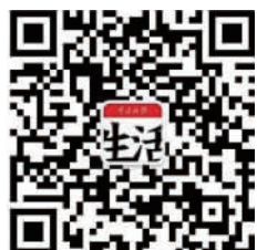
扫一扫上方二维码,关注后,回复关键词“文旅融合”——

可获取投票链接。每天都可投票,一次至多可选10个选项。同时为鼓励广大网友积极参与投票,将由宁波牛奶集团为本活动提供50个名额的奖品赞助,参与投票即有机会获得“印象宁波”纯牛奶礼盒1箱(价值48元/箱),转发投票微信或链接次数越多,获奖概率越高哦!