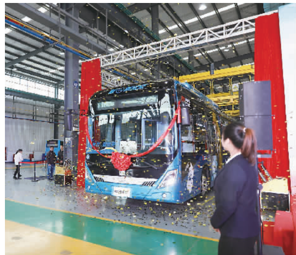
1月2日,宁波首台氢燃料电池客车在鄞州浙江中车电子有限公司下线。

在安全性方面,这款新型公交车搭载了汽车主动安全系统,在储氢系统中装配了5只安全报警器,一旦出现泄漏可及时报警。安全远程监控系统还能做到“无死角”监督反馈,可实时监控动力电池系统电压温度以及异常、整车的运行轨迹数据、驱动系统的数据等。另外,跟传统公交车比起来,这款新型公交车燃料电池的工作特性使整车更安静,人机工程学乘客座椅也提升了乘车的舒适度。