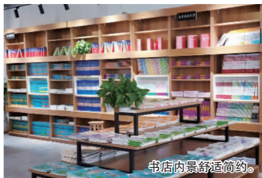
书店内景舒适简约。