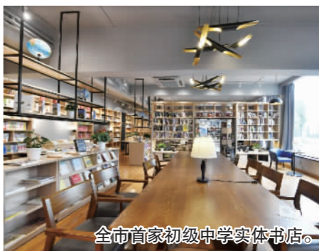
全市首家初级中学实体书店。

而今,“悦读时光”书店已成为古林镇中学集文化阵地、教育园地、实践基地、交流接待胜地于一体的文化空间。