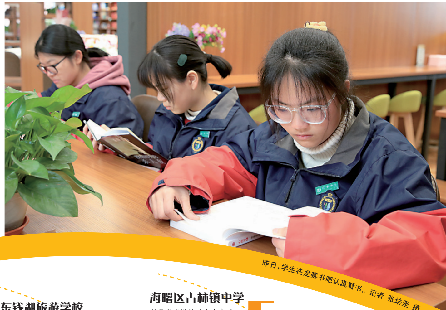
昨日,学生在龙赛书吧认真看书。