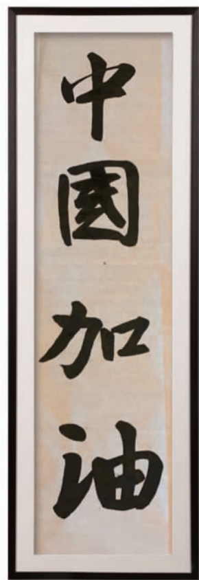
赵彬琰(证号2021229) 指导老师 蒋滨羽 宁波国家高新区实验学校504班

灾难无情人有情,我们众志成城一定会打赢这场没有硝烟的战争,待到阳光灿烂的那一天,我们一起尽情撒欢。