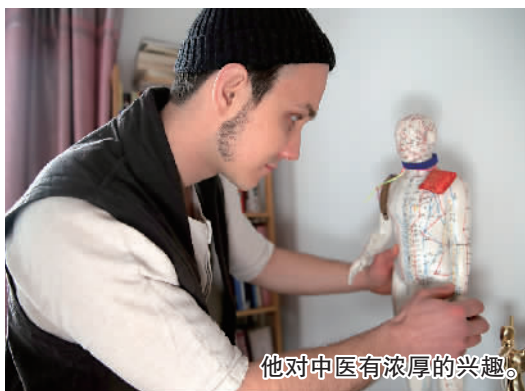
他对中医有浓厚的兴趣。